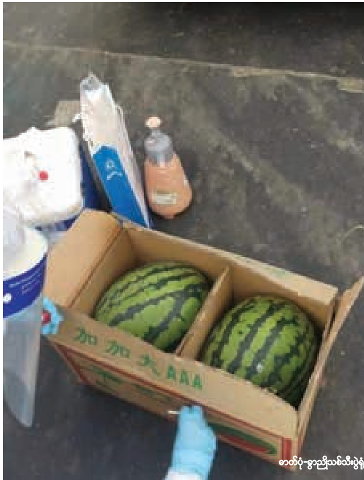
ဓာတ်ပုံ-ခွာညိုသစ်သီးပွဲရုံ

မူဆယ် ၁၀၅ မိုင် ကုန်သွယ်ရေးဇုန် မှတစ်ဆင့် တရုတ်ပြည်မအတွင်းပိုင်းသို့ တင်ပို့မည့် ဖရဲသီးများကို ကိုဗစ်ပိုး ရှိ၊ မရှိ စစ်ဆေး၍ စတင်ပို့လျက်ရှိကြောင်း မူဆယ် ၁၀၅ မိုင် သစ်သီးဝလံကုန်စည်ဒိုင် ထံမှ သိရသည်။ “ဖရဲသီးလည်း တရုတ်ပြည်မ အတွင်းပိုင်းဝင်ဖို့ COVID-19 ရောဂါ ပိုး စစ်ရတယ် (လုံးကောက်စစ်တာပါ)။ ရောဂါဖြစ်ပွားရာ ပြည်နယ် / ဒေသကို တင်ပို့ဖို့ ရောဂါကင်းစင်လက်မှတ် Certificate ပါမှ၊ ပါရင် ခွင့်ပြုပါတယ်။ ပိတ်ထားတဲ့ဈေးကွက်အချို့ ပြန်ဖွင့်မယ့် အခွင့်အလမ်းပါ” ဟု ယင်းကုန်စည်ဒိုင်မှ တာဝန်ရှိသူတစ်ဦးက ပြောကြားသည်။ ဖရဲသီးများကို ကိုဗစ်ပိုး ရှိ၊ မရှိ စစ် ဆေးပြီး တင်ပို့ခွင့်ရရှိသည့်အတွက် တရုတ် နိုင်ငံဘက်တွင် ဖရဲစားသုံးမှု ပိုမိုမြင့်တက် လာမည်ဟု မျှော်လင့်ကြောင်း သစ်သီး ကုန်သည်များက ဆိုသည်။ “အခုလို ဈေးကွက်ပြန်ကောင်း လာမယ့်အနေအထားရှိတဲ့အတွက် ဖရဲ- သခွားခင်းမှာ ကိုဗစ်သံသယလူနာ သတိပြု။ အခင်းရှင်လုပ်သားများလက်ဆေး ပါ။ Mask တပ်ပါ။ ဖြစ်နိုင်ရင် လက်အိတ် စွပ်ပါ” ဟု သစ်သီးကုန်သည်တစ်ဦးက ဆိုသည်။ ဇန်နဝါရီလ ၁၉ ရက်နေ့တွင် မူဆယ် ၁၀၅ မိုင်ကုန်သွယ်ရေးဇုန်သို့ ဖရဲ၊ သခွား